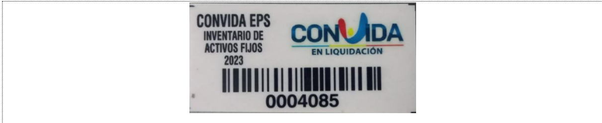
Ilustración 1 - Placas de Inventario

Teniendo en cuenta lo anterior, se trata de que todos los activos encontrados en cada ubicación se identifiquen con una Placa de Marcación.